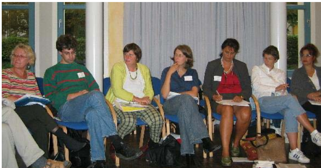
Teilnehmende während der Vorstellungsrunde