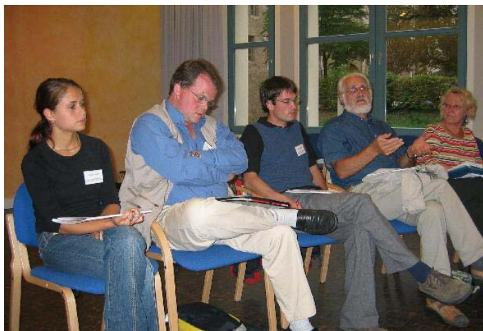
Teilnehmende beim Zuhören