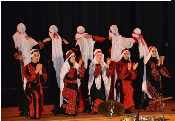
Tanz der Beduinen aus Be'er Sheva