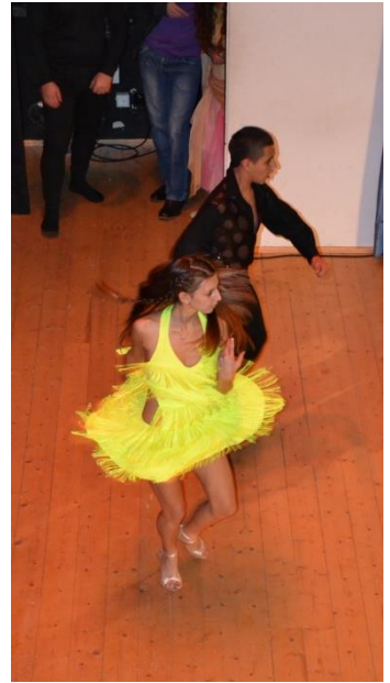
Tanzgruppe aus Haifa