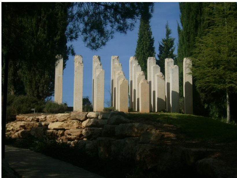
Yad Vashem, Erinnerung an ermordete Kinder

Unser Verein BEGEGNUNGEN 2005 e.V. ist seit dem Jahr 2006 erfolgreich tätig auf dem Gebiet des Jugendaustausches mit Israel. Der Verein agiert bundesweit mit lokalen Kooperationspartnern in den einzelnen Bundesländern und international mit Partnern aus Israel. Die Projekte von BEGEGNUNGEN 2005 e.V. sind von sehr großer Nachhaltigkeit geprägt – sowohl zwischen den Jugendlichen als auch zwischen den jeweiligen Kooperationspartnern, mit denen der Verein seit vielen Jahren sehr erfolgreich zusammenarbeitet. Überwiegend wird die Arbeit durch ehrenamtliches Engagement realisiert und getragen.