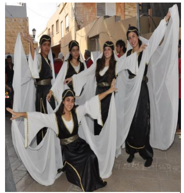
Drusische Tanzgruppe aus Haifa