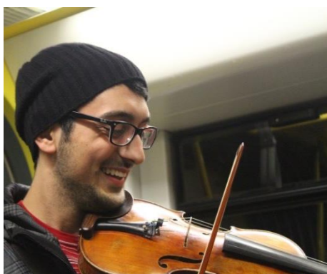
Impressionen des “Earth People” Ensembles