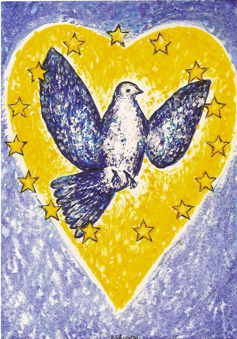
Friedenstaube von dem Weimar-Düsseldorfer Maler Bernd Schwarzer